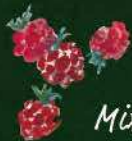
Mix dried fruits