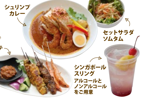
※画像はイメージです。※数量限定販売。日によって販売内容が異なります。